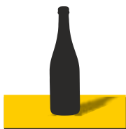
BOTTIGLIA 33 CL