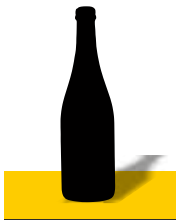
BOTTIGLIA 75 CL